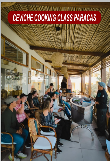
CEVICHE COOKING CLASS PARACAS