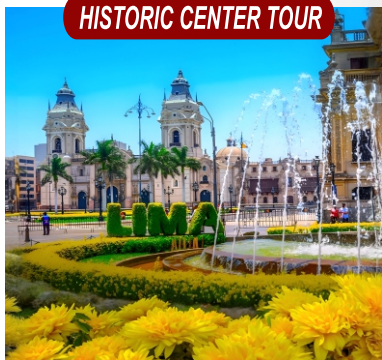
HISTORIC CENTER TOUR