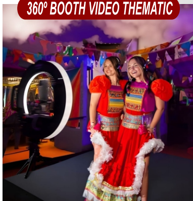
360° BOOTH VIDEO THEMATIC